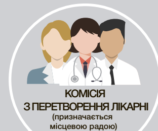
КОМІСІЯ З ПЕРЕТВОРЕННЯ ЛІКАРНІ (призначається місцевою радою)

ДО початку автономізації - презентація громаді, раді, лікарням, громадянам: