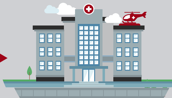
КОМУНАЛЬНЕ ПІДПРИЄМСТВО суб'єкт господарювання