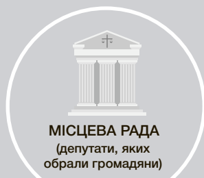
МІСЦЕВА РАДА (депутати, яких обрали громадяни)