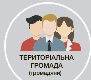
ТЕРИТОРІАЛЬНА ГРОМАДА (громадяни)