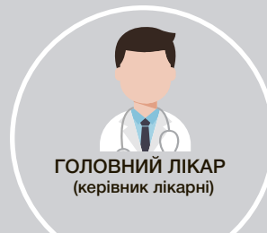
ГОЛОВНИЙ ЛІКАР (керівник лікарні)