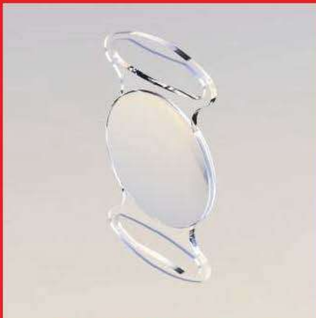
Внешний вид ИОЛ «Аквамарин» IOL "Aquamarine" (стр. 90)