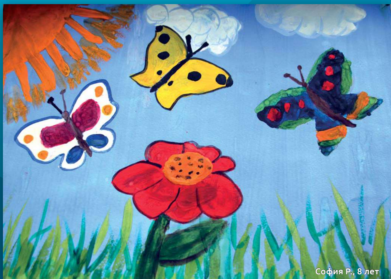
София Р., 8 лет