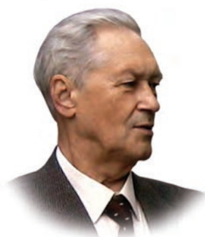
Журнал имени проф. Б.М. Костючёнка