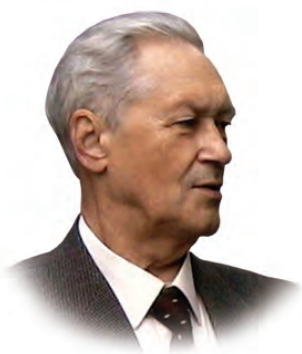
Журнал имени проф. Б.М. Костючёнка