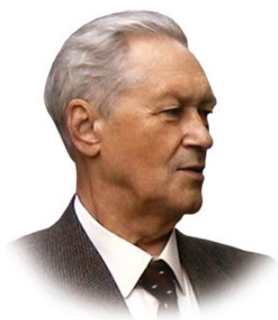
Журнал имени проф. Б.М. Костючёнка