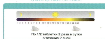
Схема приема для лечения гиперпролактинемии