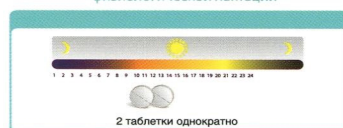
Схема приема для угнетения существующей лактации