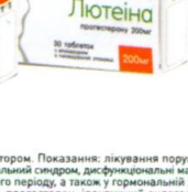
ВАГІНАЛЬНА ФОРМА 200 МГ