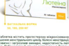
ВАГІНАЛЬНА ФОРМА 50, 100, 200 МГ