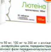
ВАГІНАЛЬНА ФОРМА 100 МГ